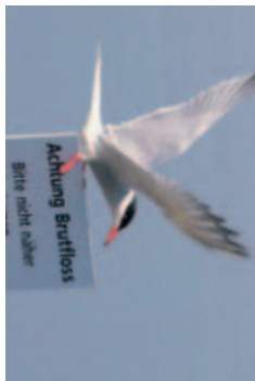
Erfolgsgeschichte: Flussseeschwalbe brütet wieder mit über 70 Paaren.