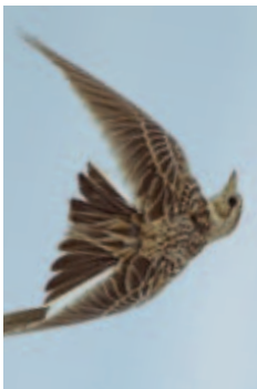
Dramatisch abgenommen: Feldlerche.