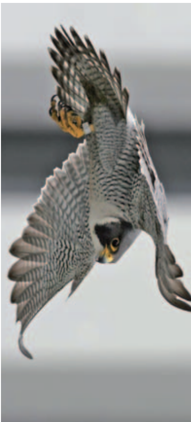
Erfolgsgeschichte: Im Kanton Zürich brüten wieder 7 Wanderfalkepaare.

Insgesamt ist die Vogelwelt im Kanton Zürich heute weniger vielfältig als vor 20 Jahren. Das darf nicht so bleiben – deshalb setzt sich ZVS/BirdLife Zürich engagiert für mehr Vielfalt in der Natur ein. Und für mehr Lebensqualität für die Zürcherinnen und Zürcher. Lassen Sie uns gemeinsam Erfolgsgeschichten schreiben!