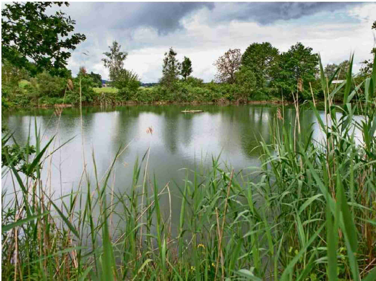
Eines von 125 Projekten: Ein Brutfloss auf einem Weiher in Altikon bietet der Flusseeeschwalbe eine Nistmöglichkeit. Bisher wird das Floss aber nur von Enten und Reiheren benutzt. Patrick Gutenberg

Themen-Nr.: 138.007 Abo-Nr.: 1094364 Seite: 15 Fläche: 94'610 mm 2