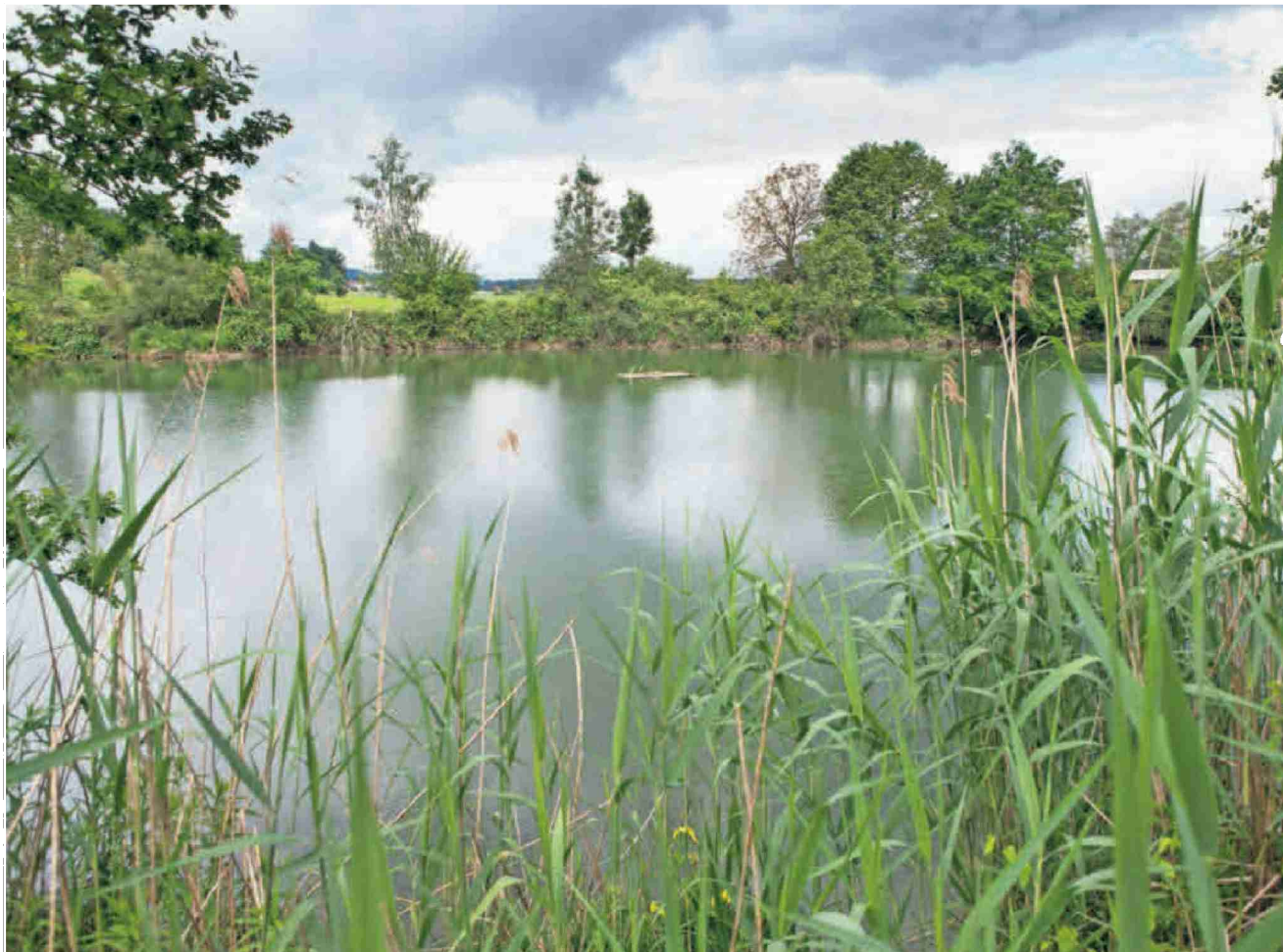
Eines von 125 Projekten: Ein Brutfloss auf einem Weiher in Altikon bietet der Flusseeeschwalbe eine Nistmöglichkeit. Bisher wird das Floss aber nur von Enten und Reiheren benutzt. Patrick Gutenberg

Themen-Nr.: 138.007 Abo-Nr.: 1094364 Seite: 17 Fläche: 95'475 mm 2