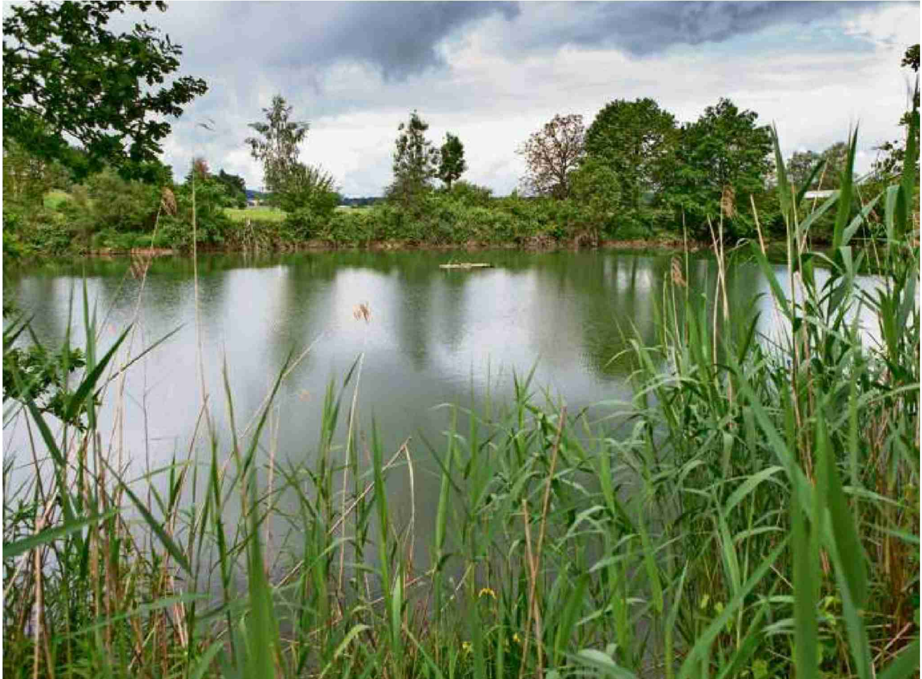
Eines von 125 Projekten: Ein Brutfloss auf einem Weiher in Altikon bietet der Flusseeschwalbe eine Nistmöglichkeit. Bisher wird das Floss aber nur von Enten und Reiherern benutzt. Patrick Gutenberg

Themen-Nr.: 138.007 Abo-Nr.: 1094364 Seite: 19 Fläche: 95'131 mm 2