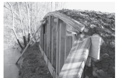
In diesem 2,5 m hohen Erdhaufen am Ufer des Sihlkanals in der Brunau/Zürich soll schon bald der Eisvogel brüten. Der Aufbau der Wand besteht aus einem soliden Fundament und Spezialmischungen aus Sand und Ton.

120 Hobby-Ornithologen trafen sich auf Einladung von SVS/BirdLife Zürich am 5. März zum traditionellen Avimonitoring-Treffen in Zürich. Resultate aus dem Avimonitoring, die Aufwertungen in der Winkler Allmend für den Kiebitz und der Rückgang des Waldlaubsängers wurden thematisiert. Das Avimonitoring im Kanton Zürich unterhält seit 1975 ein Beobachtungsnetz für Schutzgebiete, eines für seltene Arten und eines für Vogelbestände in der Normallandschaft (Landschaftsräume).