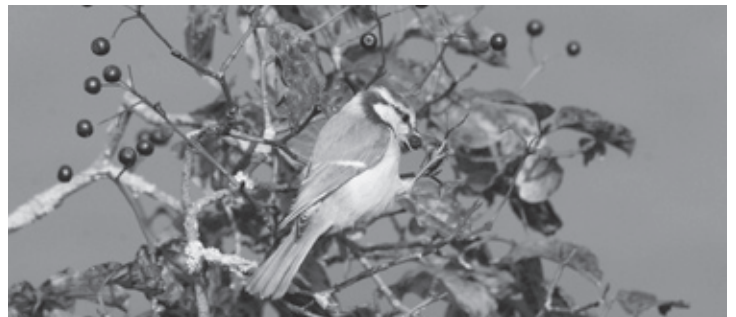
Zu welchem Strauch gehören diese Früchte, die der Blaumaise offensichtlich schmecken?

Sa, 17. September, ca. 10 – 16 Uhr, Zürich oder Umgebung