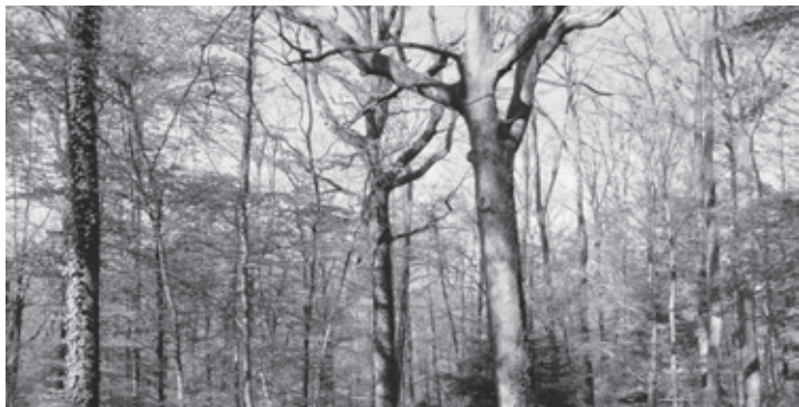
Aus den gepflanzten Jungeichen im Unter Dick in Niederhasli sollen dereinst kräftige, ausladende Biotopbäume werden.