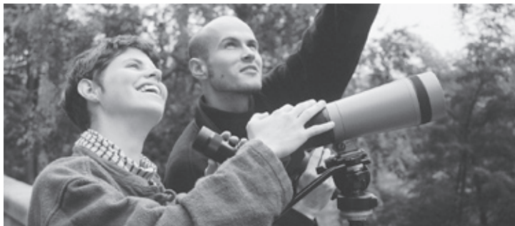
Die Ausbildungskommission hilft bei der Organisation von Grundkursen.

Di, 13. September, 19.15–21.15 Uhr, Geschäftsstelle ZVS/BirdLife Zürich, 8045 Zürich