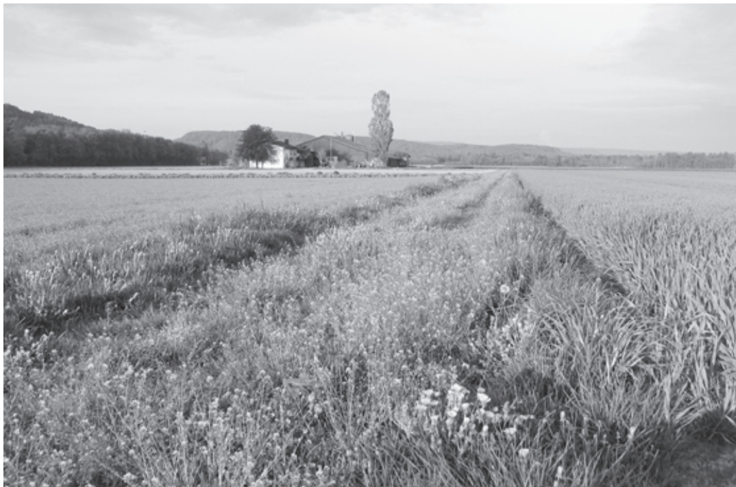
Das Rafzerfeld ist das letzte, grosse Ackerbaugesamt mit guter Qualität für Brutvögel dieses Lebensraums.