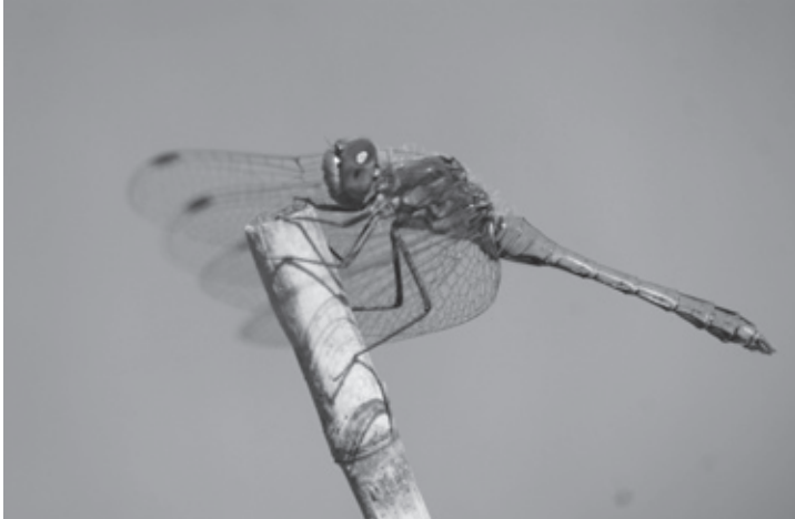
Bald wird im Neeracherried die Blutrote Heidelibelle zu sehen sein.