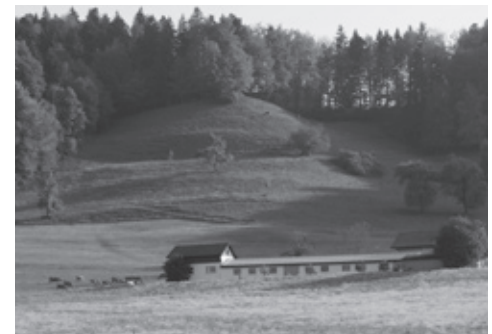
Dieser ehemalige Hühnerstall in idyllischer Umgebung soll zum Bürogebäude umgebaut werden. Pro Natura Zürich wehrt sich dagegen.

Ein aktuelles Beispiel: In Bäretswil will ein Industrieller seinen Betrieb in der Landwirtschaftszone ausbauen, der philippinische Kokosnussschalen zu Aktivkohle verarbeitet. Der Fall liegt beim Verwaltungsgericht, nachdem Pro Natura Zürich vor erster Instanz gewonnen hatte.