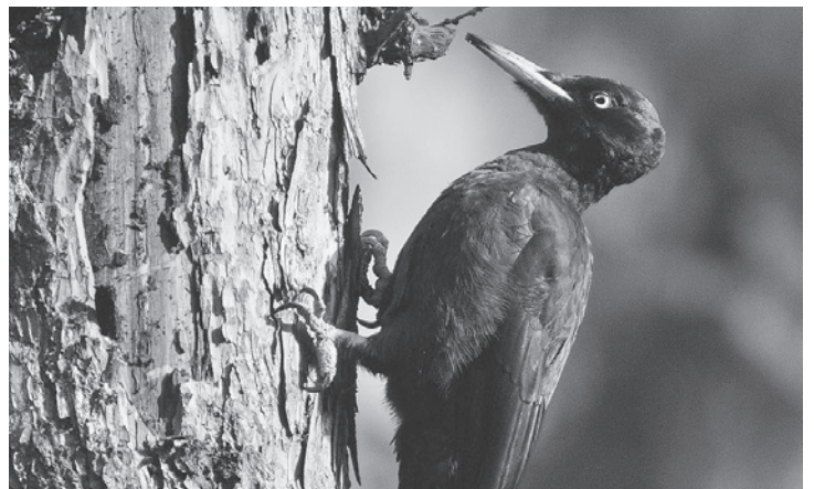
Auch Höhlenbäume, wie der Schwarzspecht sie schafft, werden bei den Weiterbildungsanlässen eine Rolle spielen.

Für 2011 – dem „Jahr des Waldes“ und dem Startjahr der SVS-Kampagne «Biodiversität – Vielfalt im Wald» – plant die Ausbildungskommission von ZVS/BirdLife Zürich verschiedene Weiterbildungsanlässe zum Lebensraum Wald. Bereits fix ist auch die Pfingstexkursion ins Val Mustair. Mehr Informationen dazu finden Sie im nächsten Mitteilungsblatt oder ab Anfang 2011 unter www.birdlife-zuerich.ch > Kurse&Veranstaltungen