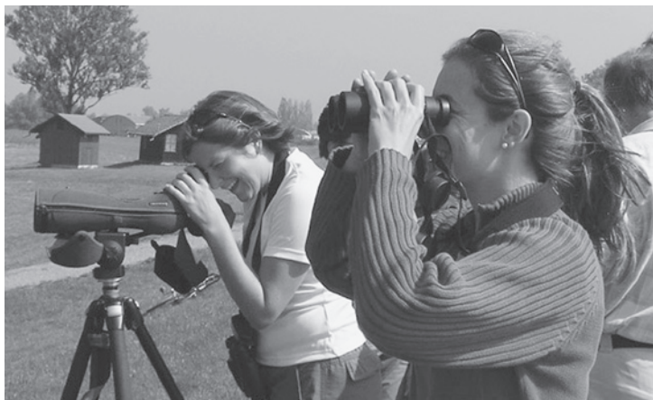
An 40 Anlässen die Vögel der Schweiz eingehend kennenlernen

In den beiden Feldornithologie-Kursen hat es noch wenige freie Plätze. Die Kurse starten am 17. bzw. 18. Januar 2011 und dauern bis Juni 2012. Bitte melden Sie sich umgehend an. Mehr Informationen unter www.birdlife-zuerich.ch > „Kurse&Veranstaltungen“ > Kurse für Fortgeschrittene