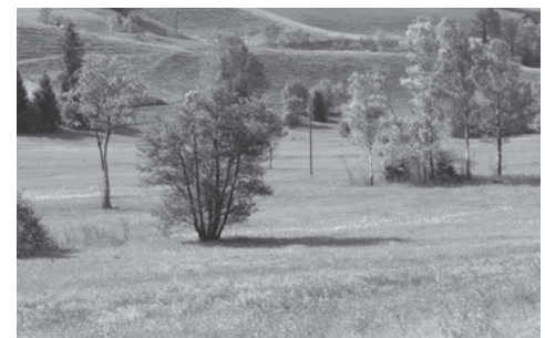
Dank eines Pro Natura-Rekurses wird die Moorlandschaft Hirzel vor übermässigem Schiesslärm verschont.

In der Landschaftsschutzzone des Rifferswilermooses wollte eine Gärtnerei ihren Betrieb intensivieren und erweitern. Pro Natura Zürich sah darin eine Verletzung der Schutzbestimmungen, und das Gericht gab ihr Recht.