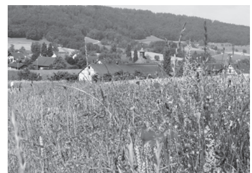
Durch das Vernetzungsprojekt 2010-2015 werden 15% der landwirtschaftlichen Nutzfläche zu wertvollen Strukturelementen für Pflanzen und Tiere.

Die Orniplan erneuert derzeit die Vernetzungsprojekte für das Wehntal (Gmd. Schöffli Dorf, Oberweningen, Schleinikon und Niederweningen) und die Gemeinde Bachs. Die neuen Bestimmungen eröffnen mehr Spielraum: So kann der Schnitttermin auf Ökowiesen flexibler gehandhabt werden oder zusätzliche Beiträge sind möglich für grosse Hochstamm-Obstgärten. Davon sollten auch die Vögel profitieren, denn der generelle Schnitttermin 15. Juni auf Ökowiesen ist für viele Vogelarten, die sich von am Boden lebenden Insekten ernähren, auch ein Problem.