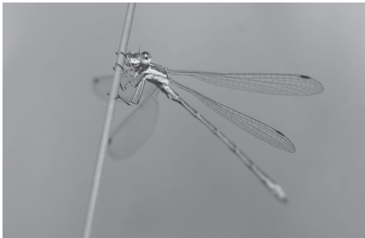
Im Neeracherried dreht sich im Jahr 2011 alles um Libellen wie die Kleine Binsenjungfer.

Öffnungszeiten des Zentrums bis Ende März 2011: