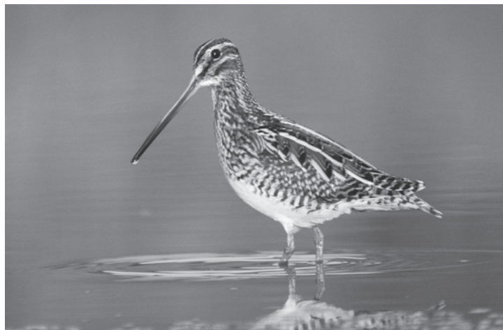
Zur Zeit Gast im Neeracher Riet, die Bekassine.