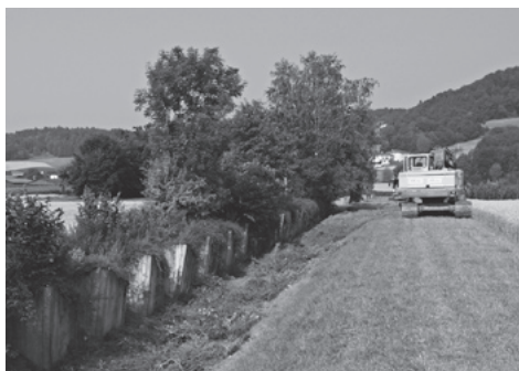
Bagger bei der Neumodellierung der Panzersperre. Links im Bild die „Toblerone“-Betonelemente und die Hecke.

Pro Natura Zürich; Andreas Hasler; Wiedingstr. 78, 8045 Zürich, Tel. 044 463 07 74, pronatura-zh@pronatura.ch , www.pronatura.ch/zh .