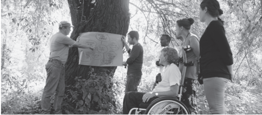
Das neue „Handbuch Vogelexkursionen“ beinhaltet über 100 spannende Methoden, wie Vögel und Natur auf neue Art und bewährte Weise erlebt werden können.

BirdLife Zürich hat in Zusammenarbeit mit der Rucksackschule ein neues Standardwerk erarbeitet: das „Handbuch Vogelexkursionen“, ein Lehrmittel für Exkursionsleitende und Lehrpersonen. Kernstück ist eine Zusammenstellung von über 100 Methoden, mit denen Vögel erlebnisreich vermittelt werden können. Ein Grundlagenteil mit Informationen zur Planung, Durchführung und Nachbereitung der Exkursion, 16 Musterexkursionen und eine Website mit viel Zusatzmaterial machen das Werk zur Fundgrube für Anfänger und Fortgeschrittene.