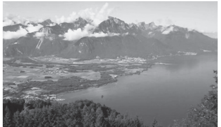
Unterwegs vom Genfersee bis in die Voralpen.