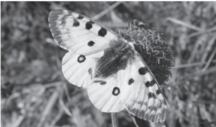
Wie hiess dieser Falter schon wieder?

Theorie 22./29.05., 12./19./26.06., Exkursionen 16./23.06.