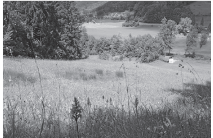
Die Magerwiese der Erliweid setzt sich mosaikartig aus trockenen Kuppenlagen und feuchteren Schatten- oder Muldenbereichen zusammen. Dementsprechend artenreich ist auch die Flora. Im Vordergrund ein Bestand des Fuchs' Knabenkrauts.

Die Einbettung dieser Aufwertungen in ein Gesamtpaket von verschiedenen Naturschutzmassnahmen tragen zum hohen ökologischen Wert der gesamten Landschaftskammer Bogen-Steinen bei. Die konkrete Höhe des Beitrags von 100xZüriNatur an die Gesamtkosten wird zur Zeit des Redaktionsschlusses noch verhandelt.