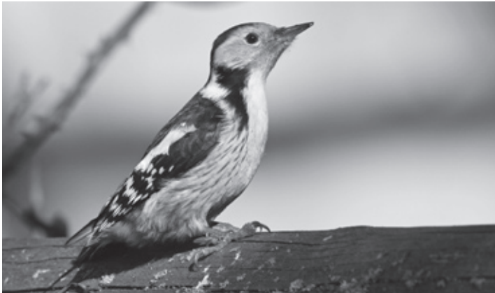
Lebt in naturschützerischen Fünf-Sterne-Wäldern: der Mittelspecht

Theorie: 20./22.03., Exkursionen/Praxis 24./31.03.2012