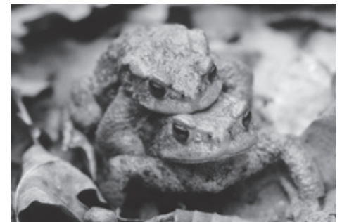
Erdkröten in Aktion

Vernissage am Sonntag, 25. März, 9.00–17.30 Uhr, Besucherzentrum Sihlwald; danach bis 4. November während den Öffnungszeiten des Besucherzentrums: Dienstag – Freitag 12.00–17.30 Uhr, Sonntag 9.00–17.30 Uhr