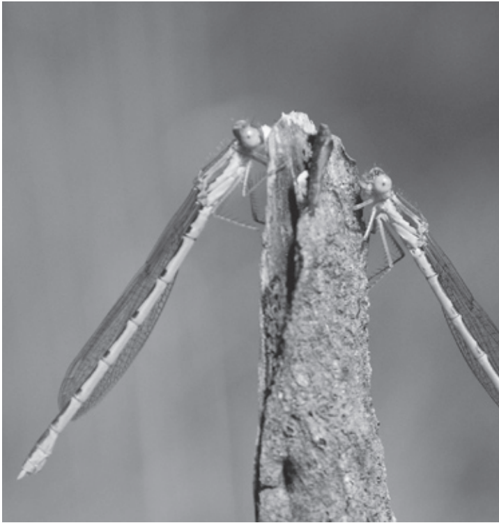
Fliegt im Winter als einzige Libelle: die Gemeine Winterlibelle

In diesen Tagen treffen bereits die allerersten Brutvögel im Neeracherried ein: Die Kiebitze weichen im Winter nur für wenige Wochen nach Frankreich oder Spanien aus und kehren so früh wie möglich in die Brutgebiete zurück. Im Lauf des März folgen dann viele weitere Zug- und Brutvögel, und ab Anfang April geht das Balzen und Brüten erst richtig los. Haben Sie gewusst, dass man jetzt – an milden Tagen – auch Libellen beobachten kann? Die Gemeine Winterlibelle überwintert als ausgewachsenes Tier, lässt sich einschneien und fliegt herum, so bald die Temperaturen steigen.