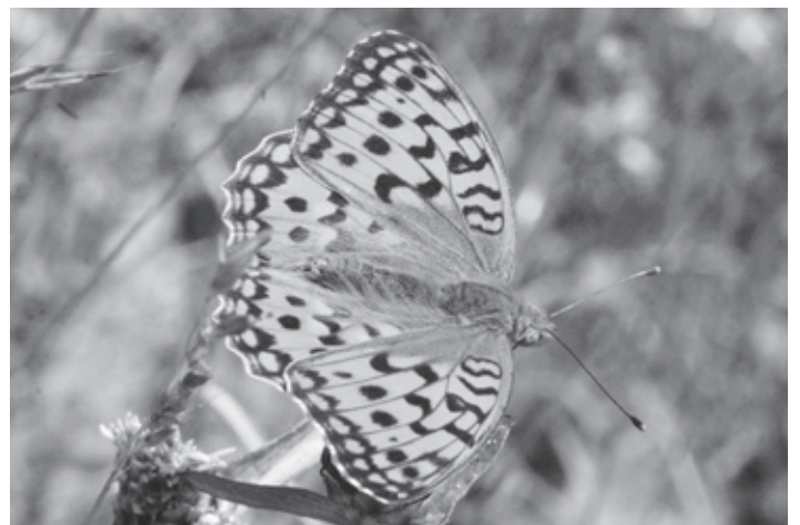
Der Märzveilchenfalter, eine der Zielarten der Aufwertungen im Bogen Sternenberg.

Kontakt: Walter Zuber , Im Muchried 6, 8907 Wettswil, info@walter-zuber.ch